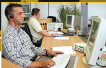
Présence mondiale: 2.000 employés à votre service dans plus de 20 filiales et plus de 50 distributeurs répartis sur les cinq continents.

Bienvenue donc dans le monde des solutions infinies de gestion des parkings et de l'accès. entervo – sur toute la ligne.