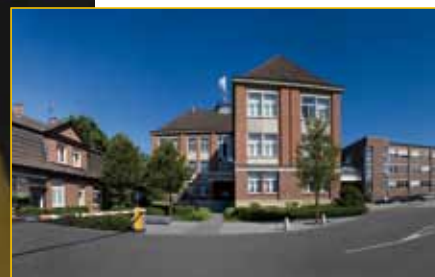
Une tradition d'innovation et d'invention depuis 1872: Scheidt & Bachmann.

Plus qu'une marque de qualité internationale, entervo est une promesse unique faite par le leader mondial dans le domaine de la gestion des parkings et des accès.